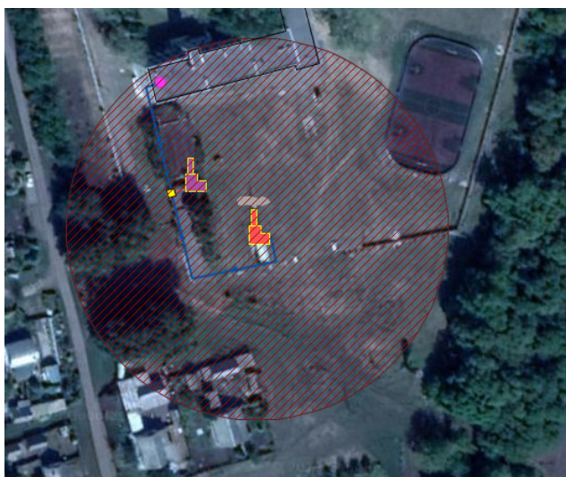
Рисунок 1.4.1. Котельная Тойдинская СОШ. п. Тойда 1-й. Зона действия

Зоны действия источников тепловой энергии, выделены на карте контурами, внутри которых расположены все объекты потребления тепловой энергии. (рисунок 1.4.1.-1.4.2.).