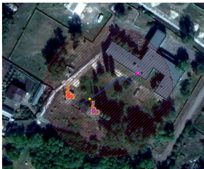
Рисунок 1.4.2. Котельная Октябрьская СОШ. п. Октябрьский. Зона действия

Зона действия источника тепловой энергии соответствует зоне действия системы централизованного теплоснабжения п. Октябрьский, описанной в п. 1.1 данной Главы.