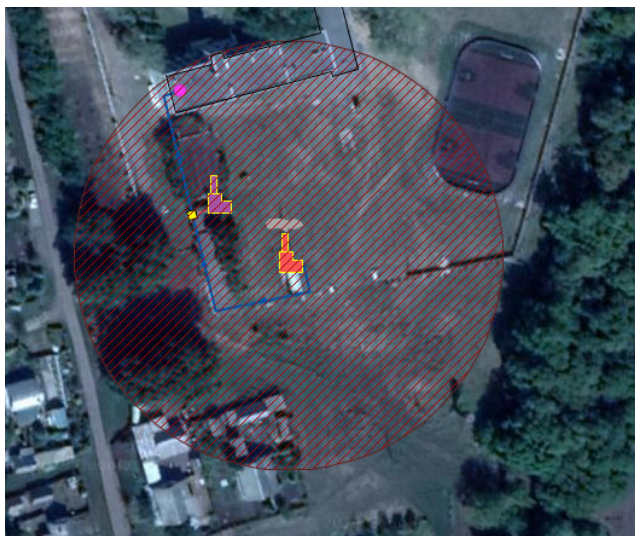
Рисунок 1.4.1. Котельная Тойдинская СОШ. п. Тойда 1-й. Зона действия

Зоны действия источников тепловой энергии, выделены на карте контурами, внутри которых расположены все объекты потребления тепловой энергии. (рисунок 1.4.1.-1.4.2.).